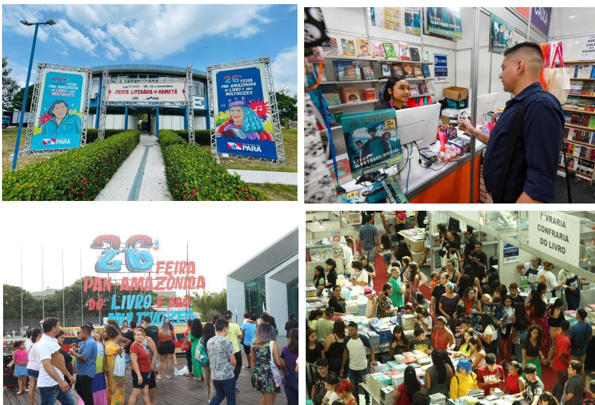
Figura 4- Festas Literárias e 26ª Feira do Livro e Das Multivozes da Amazônia

https://www.agenciapara.com.br/noticia/47387/26-feira-do-livro-e-das-multivozes-registra-mais-de-450-mil-visitantes-e-r-18-milhoes-em-negocios-