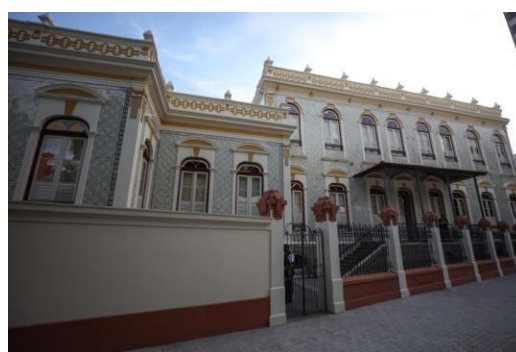
Figura 1 "-Projeto" Uma Noite nos Museus

https://www.agenciapara.com.br/noticia/48128/uma-noite-no-museu-chega-a-quinta-edicao-com-dois-espacos-culturais-convidados-ao-circuito