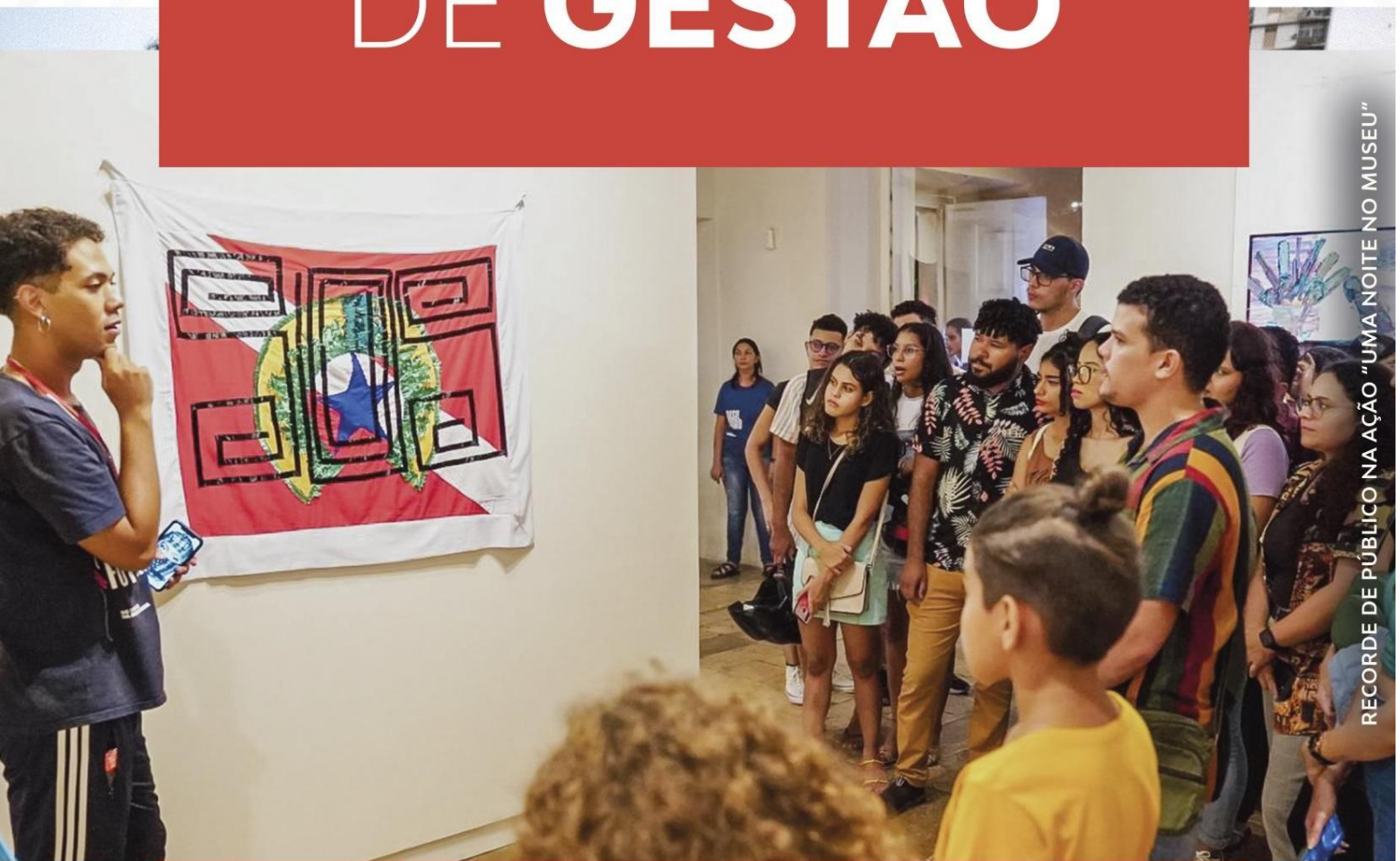
RECORDE DE PÚBLICO NA AÇÃO "UMA NOITE NO MUSEU"