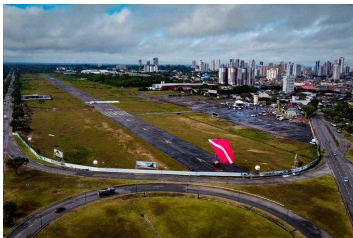
Figura 2-Parque Da Cidade - Área do Projeto

A ação no exercício corrente 2023 executou um total de R$ 11,7 milhões em recursos, sendo que desse montante, 100% foram oriundas da fonte do tesouro (recursos Ordinários) do Estado e pertencente ao grupo de despesas Investimento. Foram executados, de acordo com o sistema Sigplan um total 9 obras e projetos.